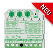
FE3 D2 Empfänger (2 Relais)