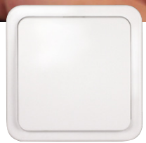
FS3 A1 Flächentaster-Funksender