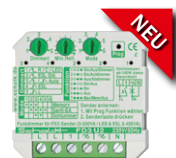
FD3 U2 Funk-Dimmer