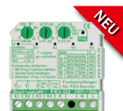
FE3 Q2 Empfänger (4 Relais)