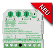
FE3 S2 Empfänger (1 Relais)