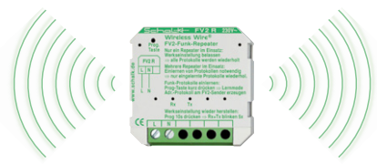
FV2 R Funk-Repeater