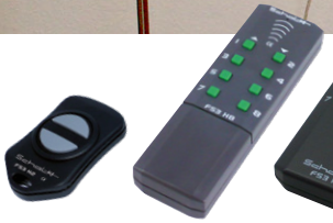
FS3 H2 / FS3 H8 / FS3 HC Funkhandsender